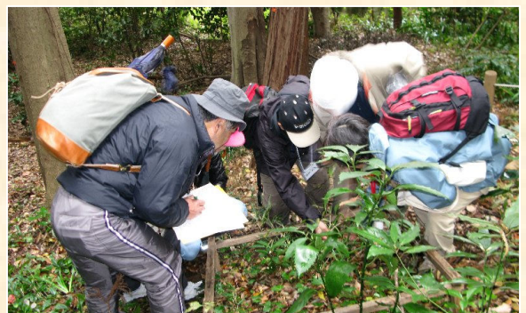
入間樹林にて 方形枠調査の実習(雑木林塾)