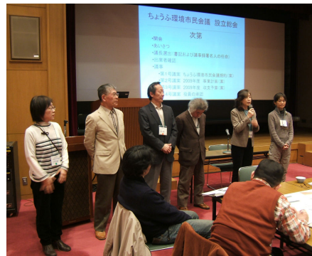
役員・事務局の紹介 (左から)

7年間活動を続けてきた、ちょうふ環境市民懇談会を発展的に解散し、あらたに「ちょうふ環境市民会議」が設立されました。「環境基本計画に基づき、これまでの自然環境保全分野に加えて、ごみ問題・資源のリサイクル・省エネルギーなどの生活環境改善分野の市民や様々な団体とともに地域に立脚した活動を行いながら、環境の視点からとらえたまちづくりの課題に取り組みます。」と決意が述べられました。